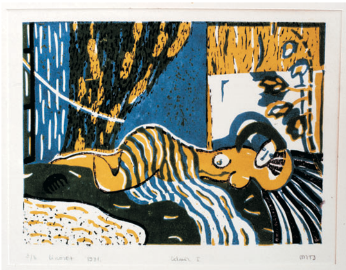
Odmor I, linorez u boji, 1981.