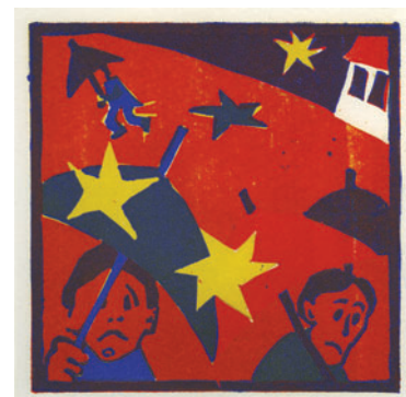
Kišobrani i zvijezde, ilustracija iz slikovnice Prinke , linorez u boji, 1979.