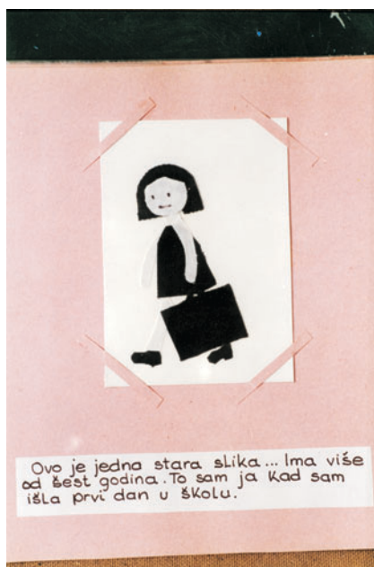
Stranica iz slikovnice Obiteljski fotoalbum , kolaž od tkanina na papiru, 1977.