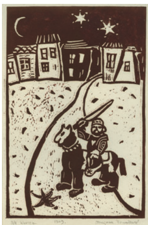
Mali konjanik, ilustracija, linorez, 1979

1986. Samostalna izložba: Izložba unikatnih slikovnica i ilustracija , Zagreb: Galerija knjižare Mladost , Masarykova 5, 3–30. 06. 1986. Solo exhibition: Exhibition of unique items of picture books, June 1986.