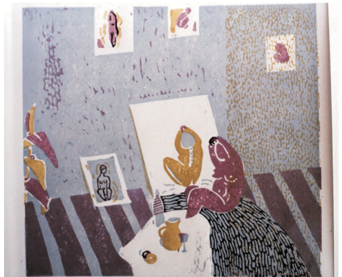
Odmor II, linorez u boji, 1981.