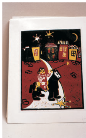
Čarobnjak, 2, ilustracija na stražnjoj korici slikovnice Prinke , linorez u boji, 1979.