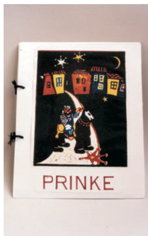
Čarobnjak, 1, ilustracija na naslovnici slikovnice Prinke , linorez u boji, 1979.